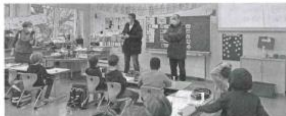
Auch die Schülerinnen und Schüler der Grundschule Schlechtbach bekamen einen Besuch